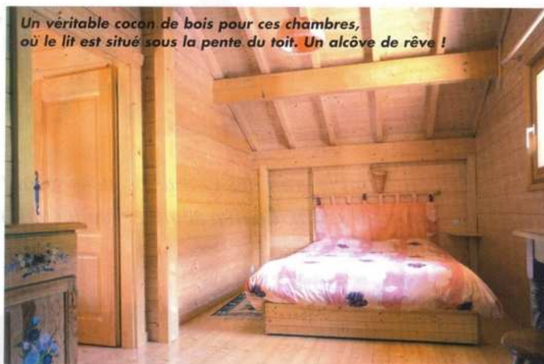
Un véritable cocon de bois pour ces chambres, où le lit est situé sous la pente du toit. Un alcôve de rêve !