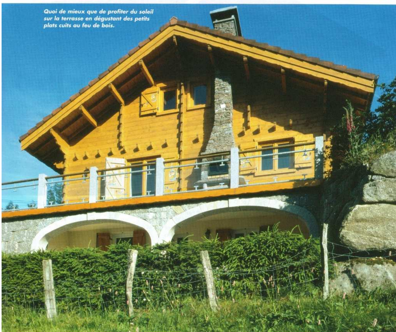
Quoi de mieux que de profiter du soleil sur la terrasse en dégustant des petits plats cuits au feu de bois.