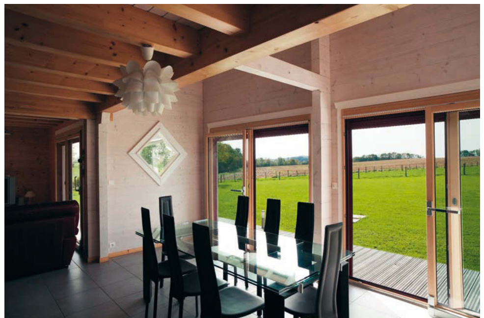
Les propriétaires ont choisi l'alternance, laissant par endroit le bois s'exprimer dans sa teinte d'origine et d'autre fois le lasurant en blanc pour accentuer la luminosité, en particulier lorsqu'elle provient du grand outeau.

ça ne l'empêche pas de poser une pâte architecturale avec des effets, pas forcément spectaculaires, mais discrets et bien faits. C'est ce que j'appelle des " deloreries ". Tout en nuances. »