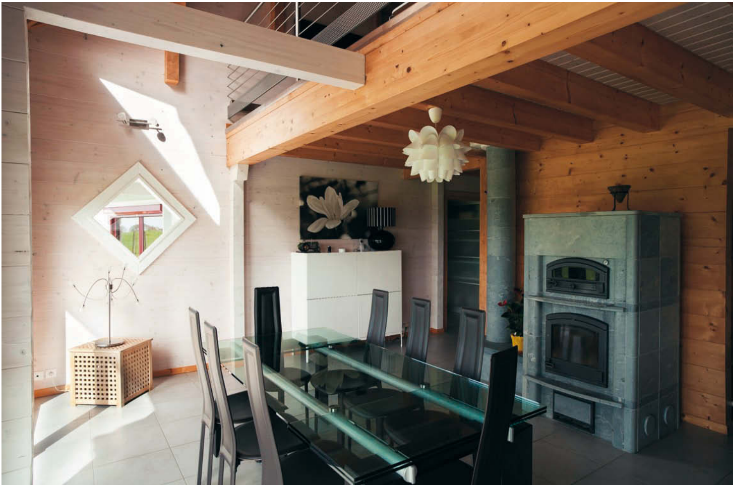
Le poêle de masse Tulikivi, le principal chauffage de la maison. Les poêles-cheminées fonctionnent selon le principe du contre-courant, qui permet une récupération précise de l'énergie calorifique présente dans les gaz de combustion incandescents. L'énergie calorifique s'accumule dans les pierres qui diffusent la chaleur dans la pièce sous forme de rayonnement thermique.

Laurent Chauvin pense par exemple au solivage apparent qui file au-dessus de la cuisine ou encore à la petite terrasse couverte côté Sud et justement dimensionnée. « Les solives sans le