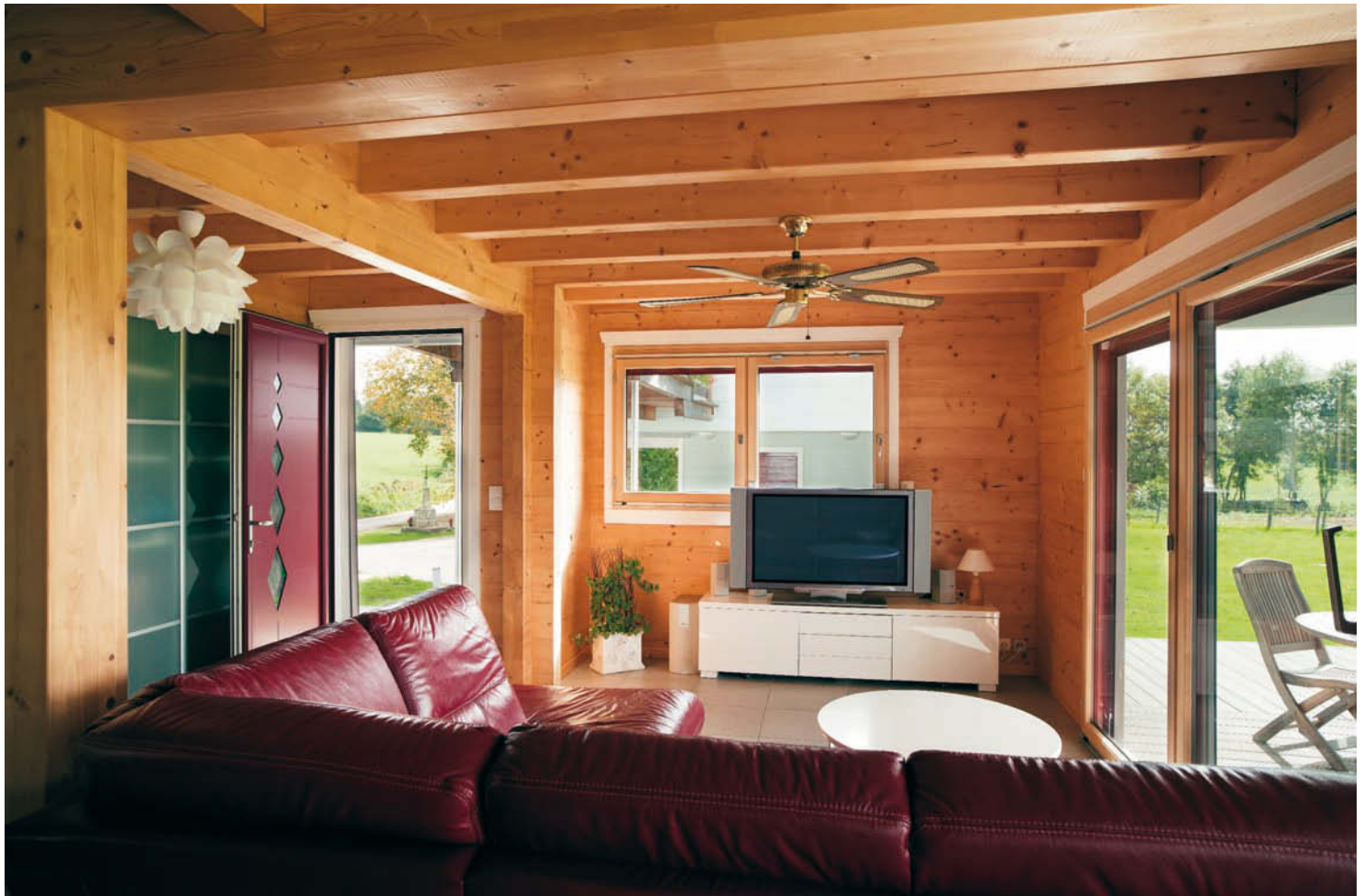
Toutes les ouvertures proviennent de MC France. Réalisées en bois (hêtre) et aluminium, elles sont équipées d'un double vitrage. L'orientation de la maison a été travaillée pour profiter de l'ensoleillement tout au long de la journée. La façade principale fait face au Sud-Ouest.