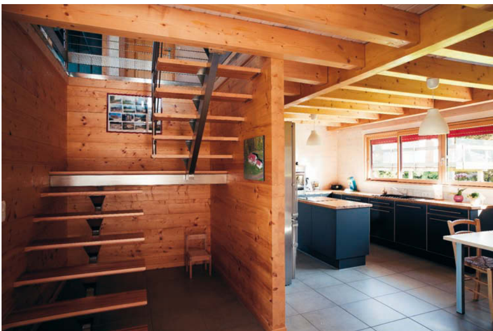
Léger, cet escalier repose sur une structure inox et des marches en hêtre lamellé-collé. C'est autour de lui que tourne toute l'organisation du rez-de-chaussée. C'est l'unique séparation entre les pièces.