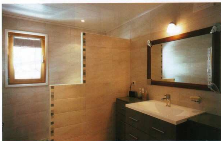
La salle de bains profite d'une douche à l'italienne, couverte de petits galets.