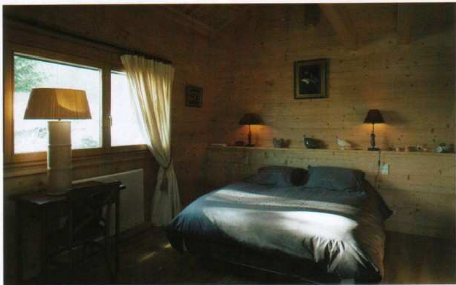
La chambre principale se chauffe d'un parquet en frêne sous un lambrisage de sapin. Pour ne pas avoir à multiplier les aller-retour d'un étage à l'autre, les propriétaires vivent sur un seul et même plan. Le second niveau regroupe deux chambres pour les amis ou la famille.

Réalisation : Constructions Chauvin – Mont-sous-Vaudrey (39) Architecte : Jean-Michel Perroulaz – Onnion (74)